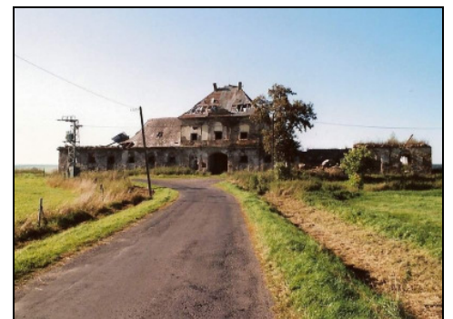
Smrť dvůr – patřící klášteru v Teplé – v r. 1989, kdy ho opustilo komunistické JZD

V dubnu tohoto roku uběhlo šedesát let od této tragické události novodobých českých dějin, srovnatelné snad jen s řáděním husitů ve středověku.